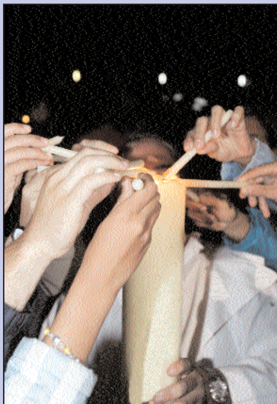
(JUAN PABLO II, Mensaje para la jornada mundial de la Juventud 2005, n. 5)

La adoración del Dios verdadero constituye un auténtico acto de resistencia contra toda forma de idolatría. Adorad a Cristo: Él es la Roca sobre la que construir vuestro futuro y un mundo más justo y solidario. Jesús es el Príncipe de la paz, la fuente del perdón y de la reconciliación, que puede hacer hermanos a todos los miembros de la familia humana.